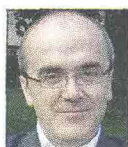
di STEFANO MARCHETTI

Sono stati genitori talvolta distratti, oggi si scoprono nonni con una gioia speciale